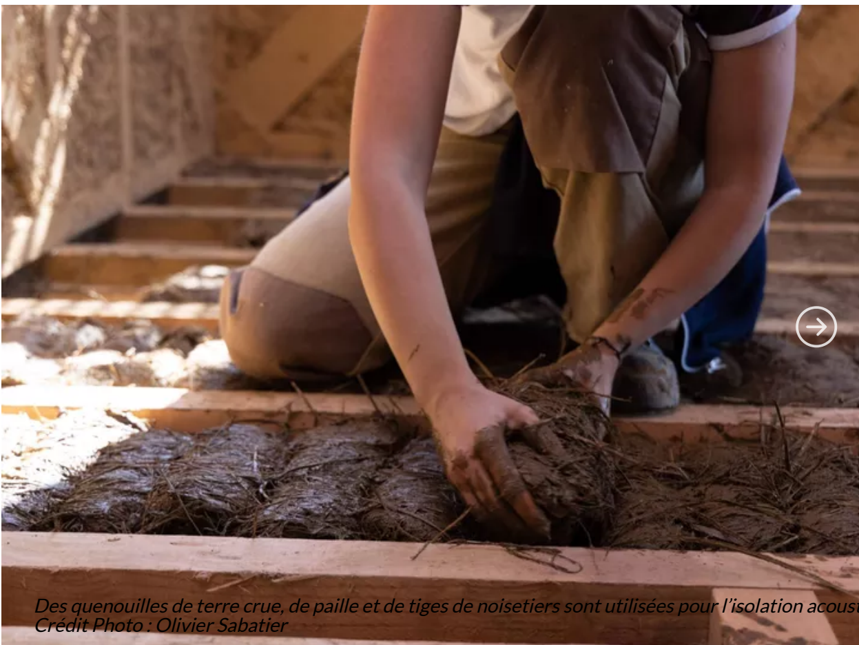
Des quenouilles de terre crue, de paille et de tiges de noisetiers sont utilisées pour l'isolation acoustique.

Des matériaux provenant de moins de 150 kilomètres, non transformés qui plus est, voici en effet l'ambitieux cahier des charges dressé par la coopérative Anatomies d'Architecture lorsqu'elle a rénové une longère de 80 m 2 à Sap-en-Auge, dans l'Orne (61). Un couple de boulangers a fait l'acquisition du château de Costil et de ses dépendances et a décidé de laisser carte blanche à ces architectes qui mettent le curseur écologique haut. « On s'est fixé comme objectif d'utiliser 0 gramme de béton et 0 gramme de plastique même si dans la pratique, il y a toujours du plastique dans les poignées de porte par exemple » , résume Raphaël Walther, architecte.